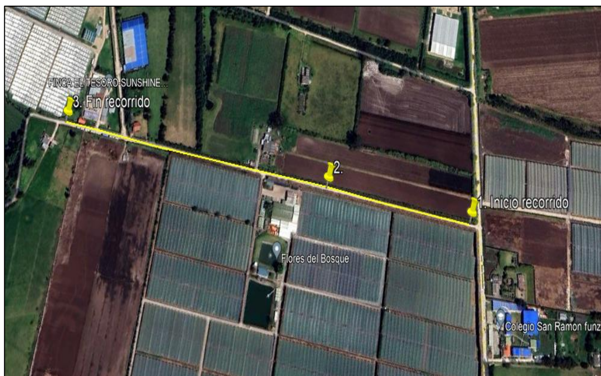
Ilustración 1. Recorrido verificación ambiental -Vereda El Cacique.

Se realizó recorrido de control y vigilancia de los componentes ambientales en áreas rurales del municipio de Funza, vereda El Cacique, el día 20 de junio de 2024, desde las coordenadas 4°44'47.926"N - 74°12'13.712"W hasta las coordenadas 4°44'40.306"N-74°12'40.808"W (ver ilustración 1. Ruta amarilla), con el fin de verificar las condiciones ambientales, identificar posibles afectaciones a los recursos naturales y realizar las acciones de prevención correspondientes.